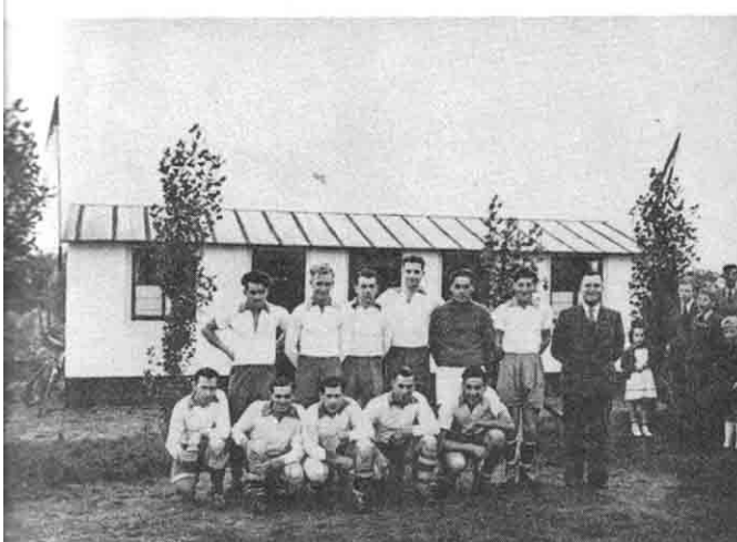
Het kampioenselftal 1954/1955 voor het eerste kleedlokaal. 19-9-1954.