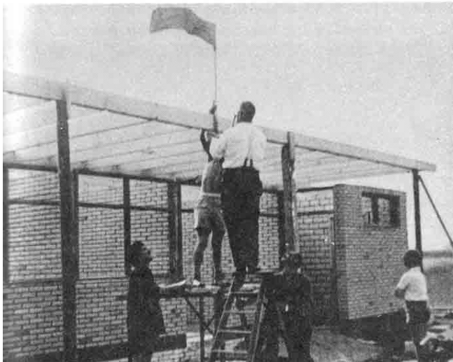
Aanleg sportterrein en bouw kleedlokalen. Zomer 1964.

klasse echt het plafond was. Hoe lang kon de ploeg zich handhaven. Gelukkig stond FCEB bij het 40-jarig bestaan in 1958 nog in de derde klasse, want het zou sneu zijn als dit feest met een degradatie "gevierd" moest worden. In 1961 moest er een nieuw sportterrein komen. Het was erg moeilijk waar het moest komen te liggen. Op 27 september 1964 werd het zelf aangelegde sportveld en het zelf gebouwde kleedlokaal geopend.